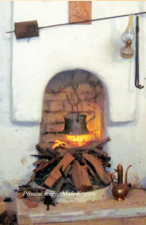
Privatni muzej, Malo Kruševo

Tradicionalno zanimanje žena u ovoj sredini jeste proizvodnja nošnji tkanih na razboju i ukrašenih raznim bojama. To je zanat koji još uvek postoji i daje mogućnost da se kreira privlačni proizvod, razvijen uz umešnost ručnog rada žena iz opštine Klina.