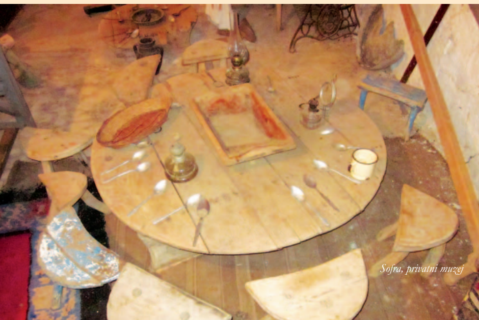
Sofra, privatni muzej