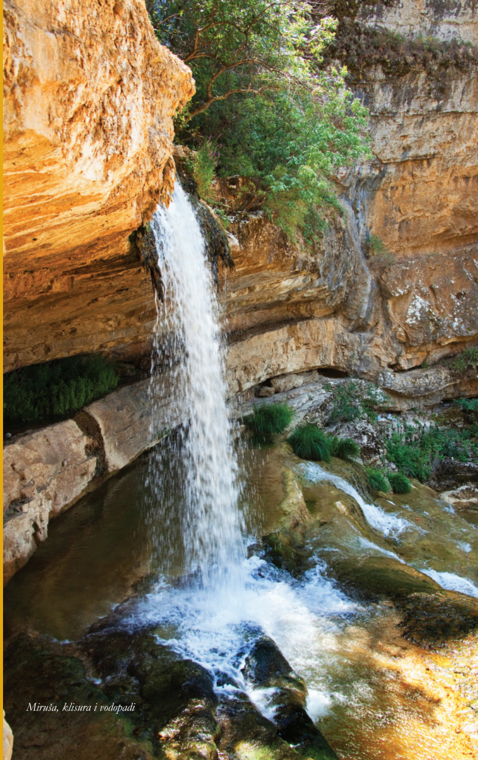
Miruša, klišura i vodopadi

• Pilot aktivnosti su sprovedene istovremeno u šest opština na zapadu Kosova. One su obuhvatile tri komponente koje su imale presudnu ulogu za angažovanje zajednice u toku pripreme plana regionalne baštine.