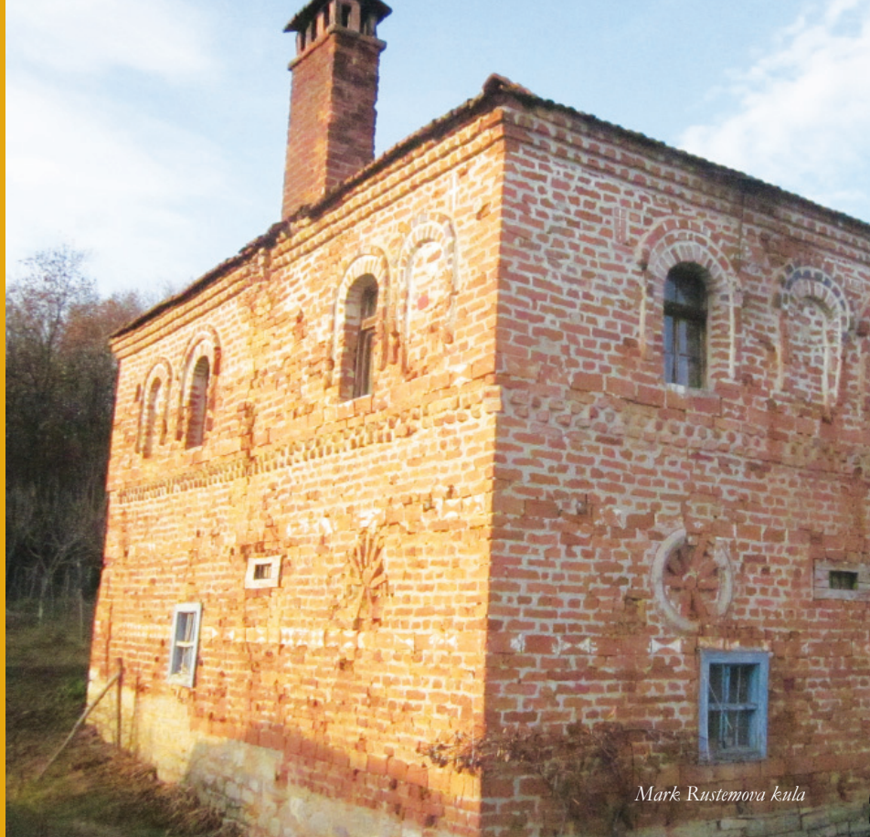
Mark Rustemova kula

Da bi se obezbedilo aktivno angažovanje aktera, projekat PKRK je usvojio sledeću metodologiju i tok rada tamo gde su zajednice konstantno iznosile mišljenje i dale doprinos u kreiranju politike, a na nivou zajednice podstican je prenos redovnog znanja i sposobnosti.