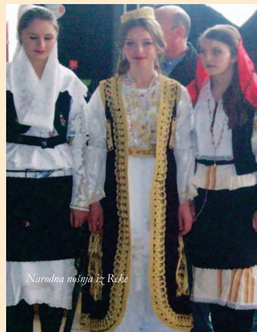
Narodna nošnja iz Reke